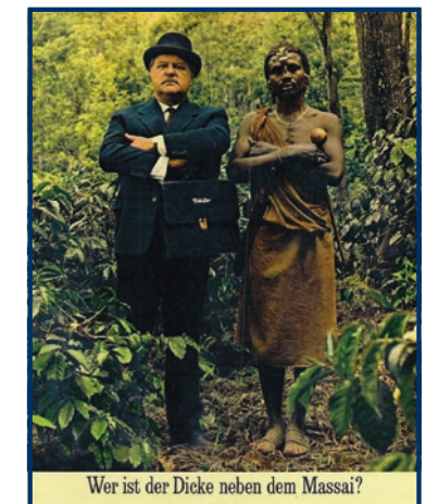
Wer ist der Dicke neben dem Massai?

Kaffee-Experte Mr. Pithey ist unterwegs in Erzeugerländern, inspiziert Kaffeepflanzen, fährt mit auf Kaffeeschiffen und man sieht ihn mit den Kunden in der Filiale.