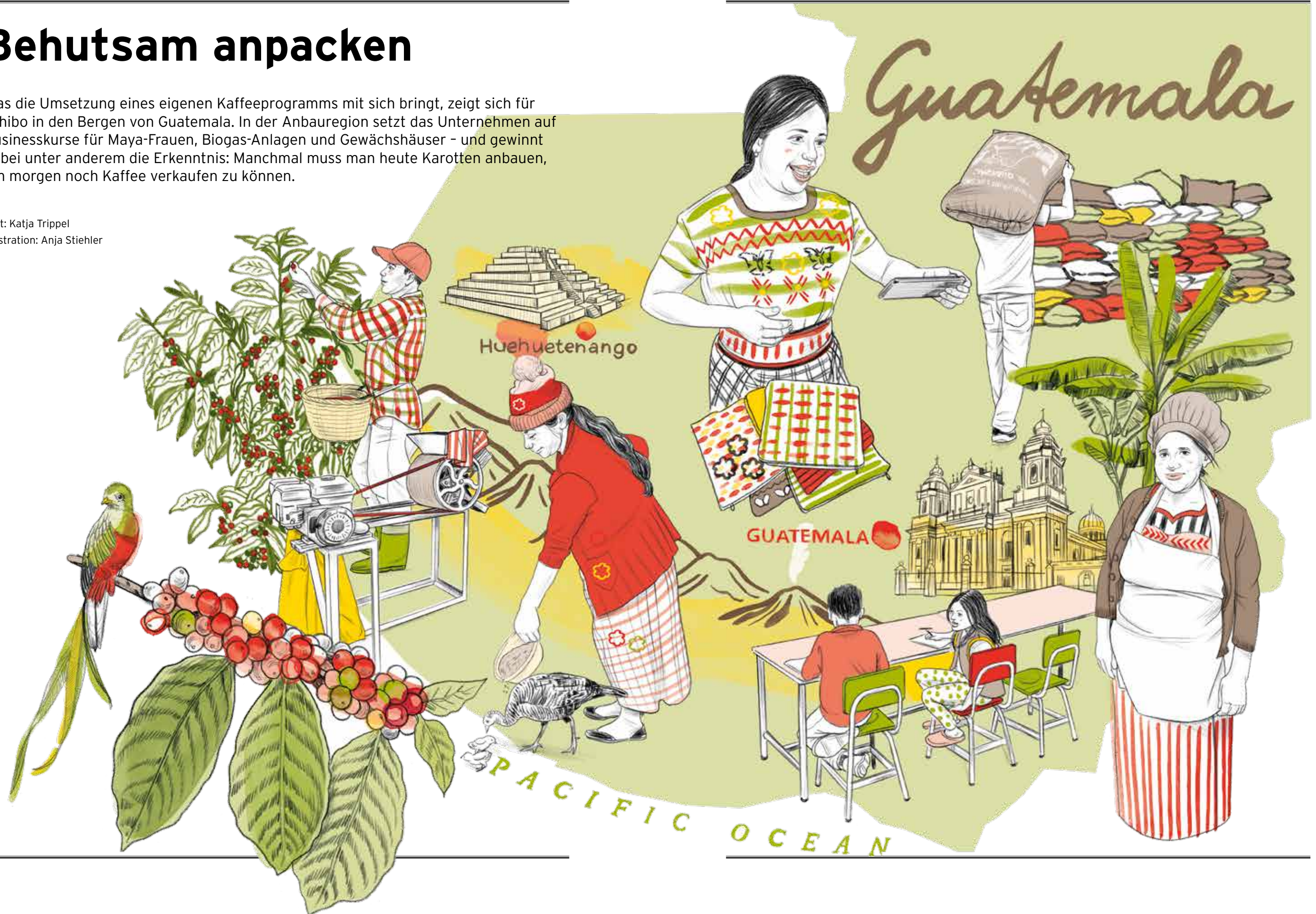
Illustration: Anja Stiehler