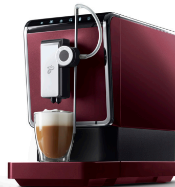
ESPERTO PRO ab ca. 269 €