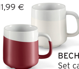
BECHER-SET Set ca. 9,99 €