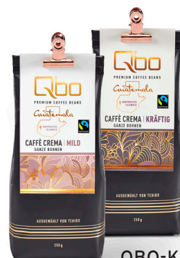
QBO-KAFFEE ca. 4,99 €