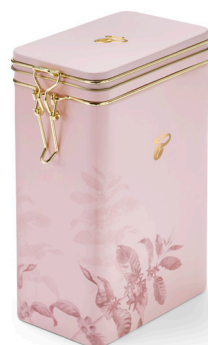
KAFFEEDOSE ROSA BLÜTEN ca. 4,99 €