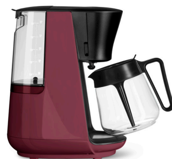
LET'S BREW ab ca. 49 €