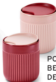
PORZELLAN- BECHER MIT DECKEL ca. 11,99 €