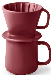
BECHER MIT FILTER ca. 11,99 €